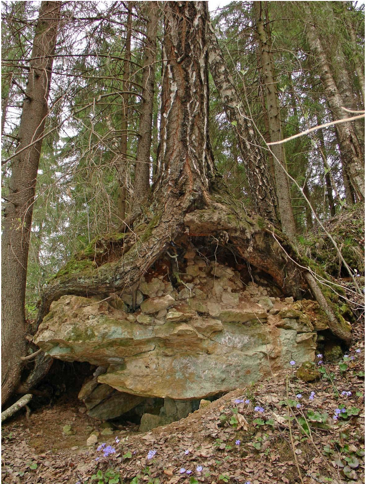
Дерево, камень, цветы.