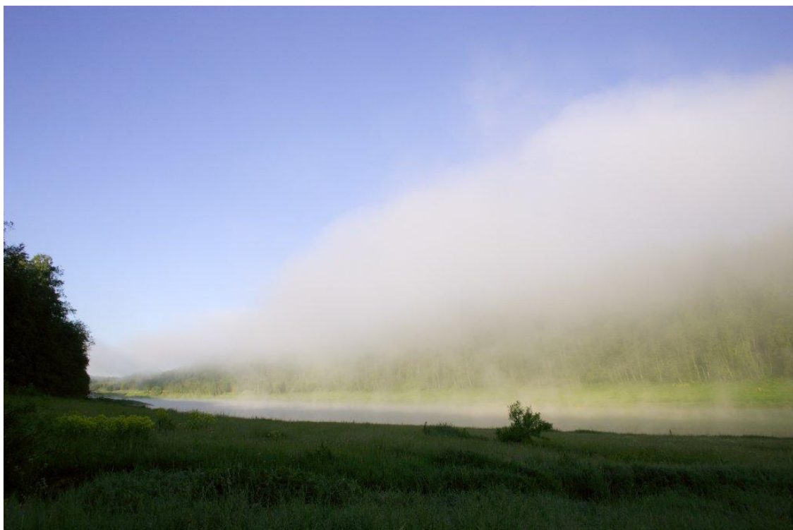
Вид на лагерь “Чёрного Солнца” в момент восхода обычного.