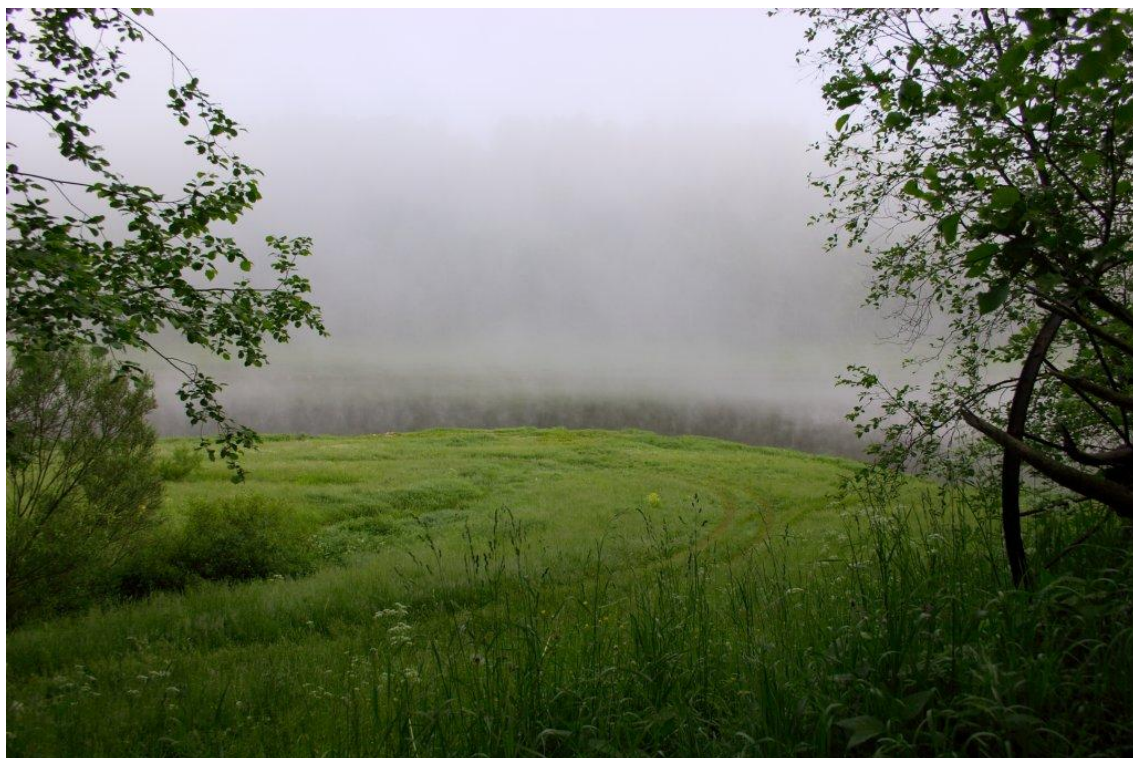
Утренний туман над Волгой.