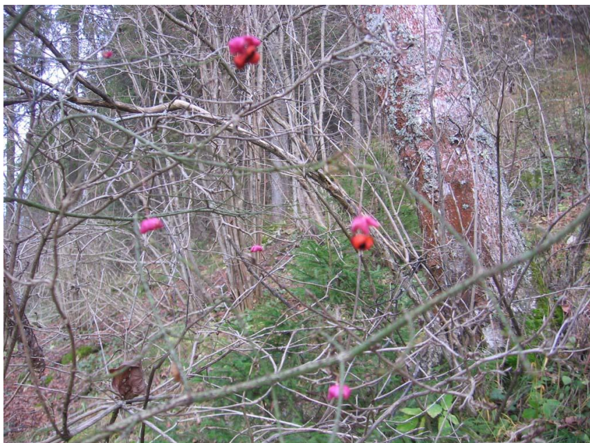
Последние цветы осени...