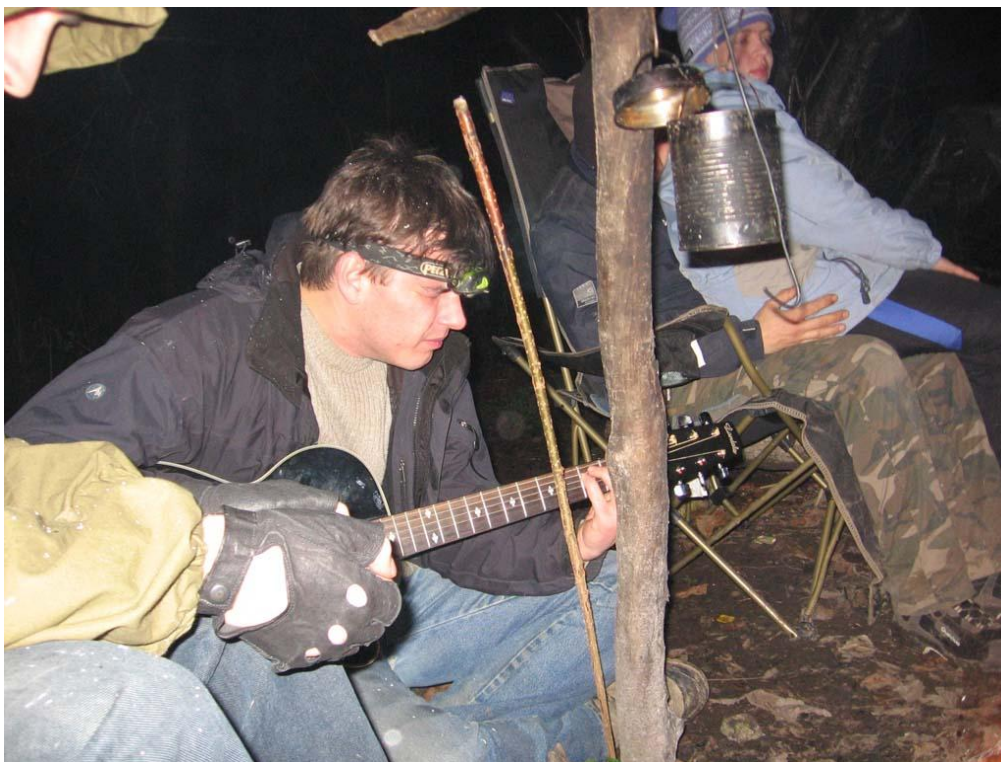
Шаманство иного рода: поёт Асмодей!