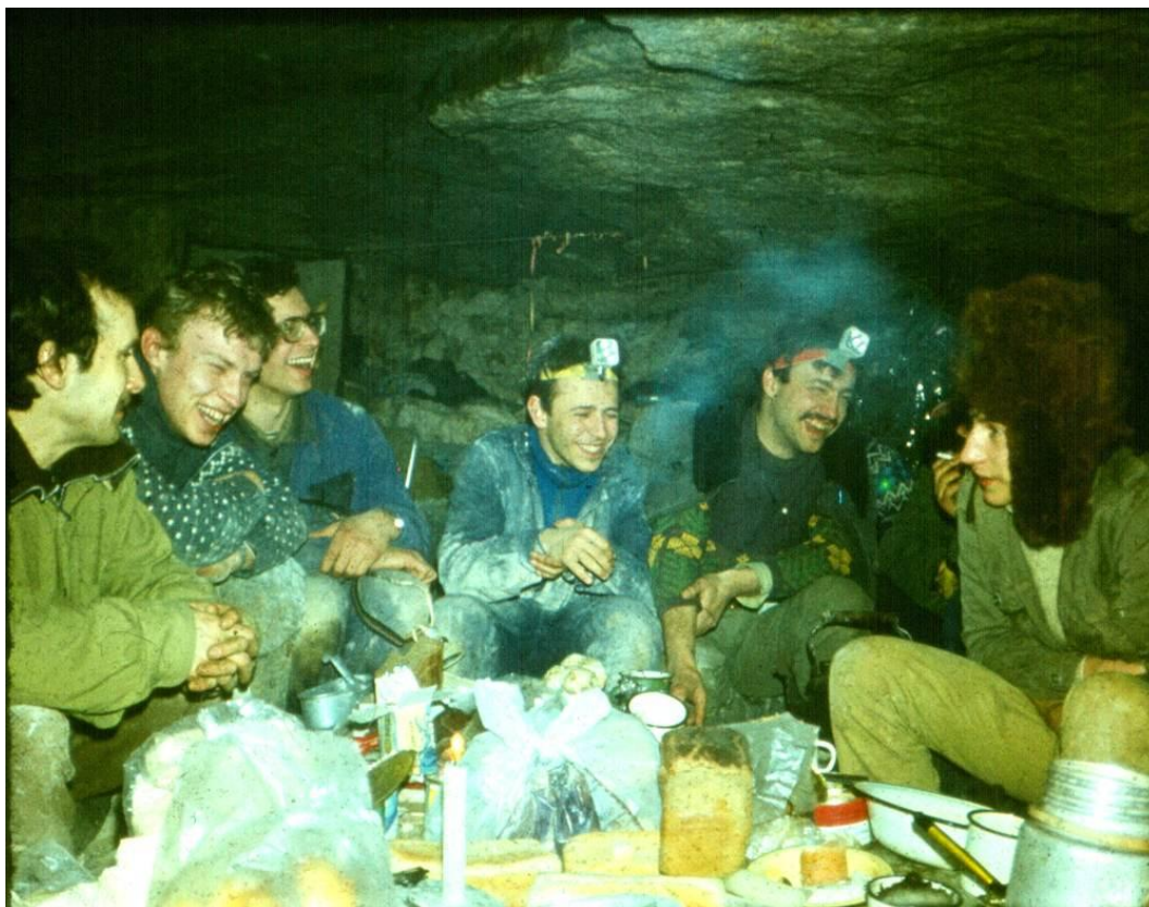
Лисья, грот Уэм, ноябрьские иды 1985 года.