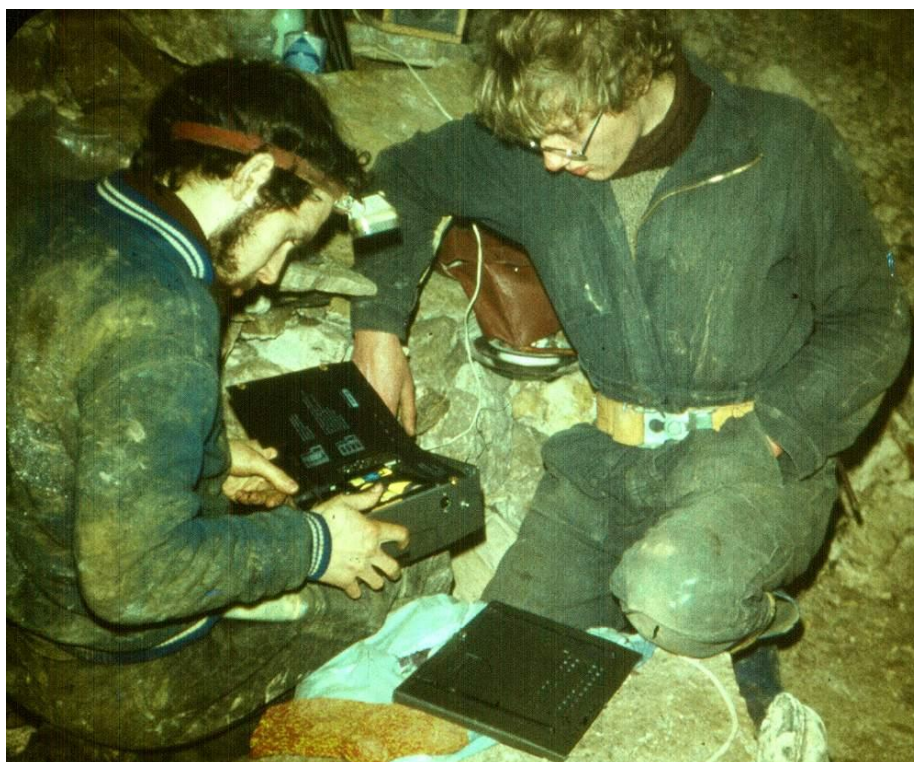
Мы с Длинным Кирой ремонтируем в подземных условиях «УНЕР-4400». ( НГ-87 в Лисьей )