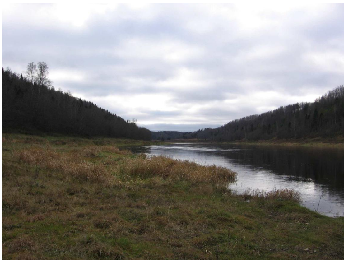
... и непогода — уходит...