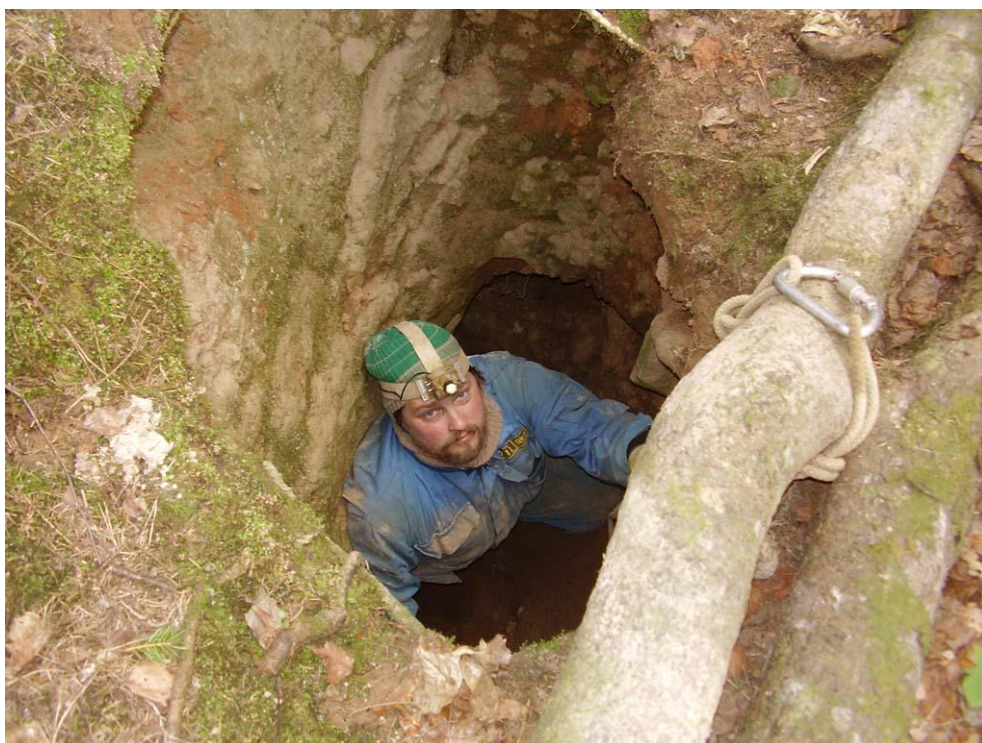
Вход в Комическую трудноват без тросовой лестницы. ( Зияющую Глубину штурмует Кис-Кисыч. )