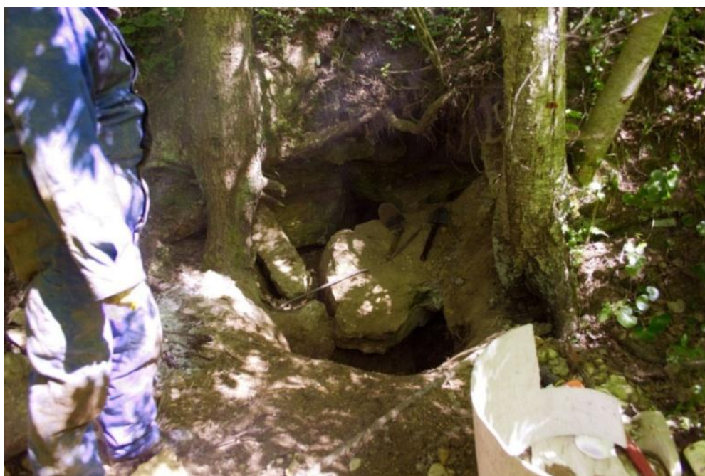
Копаем Соседку. На переднем плане справа – очередное раздолбанное ведро.