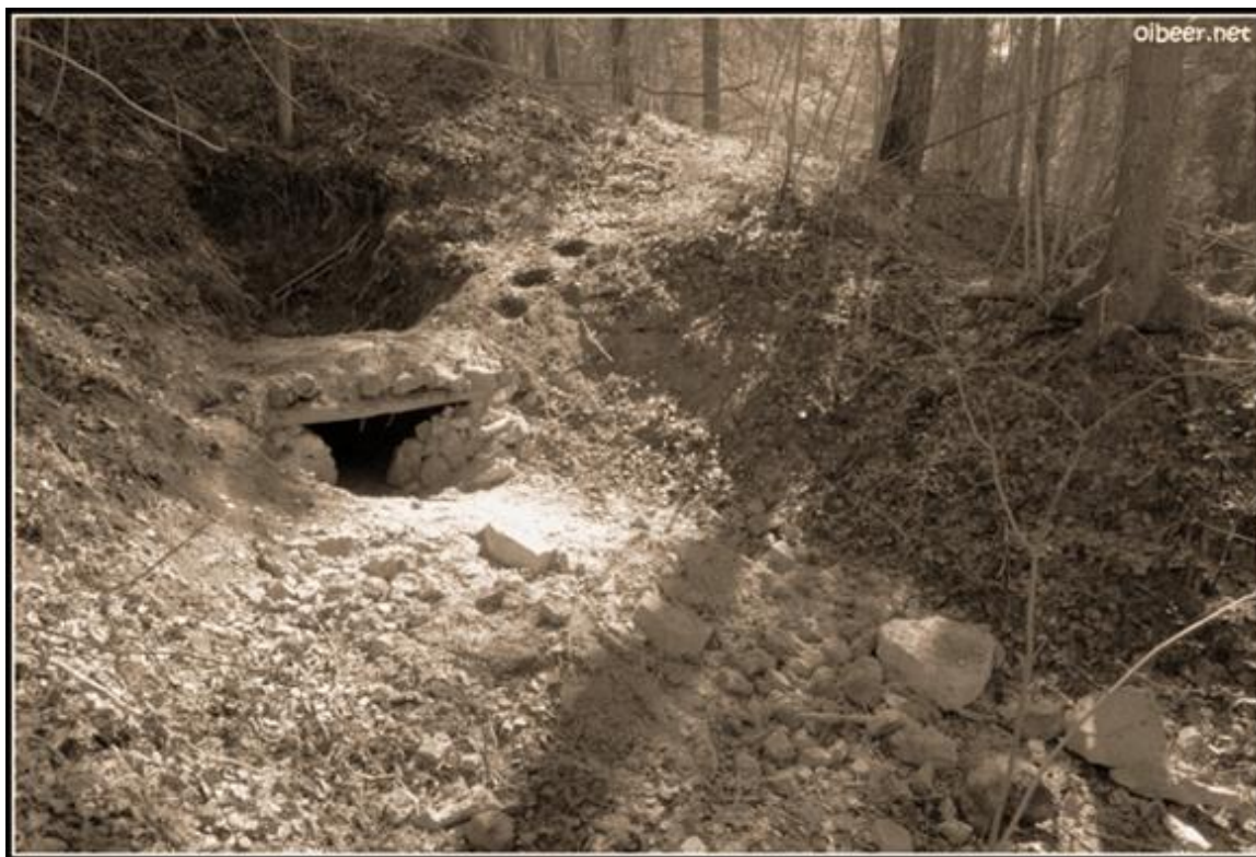
Ремастированный вход в ЗубКи.