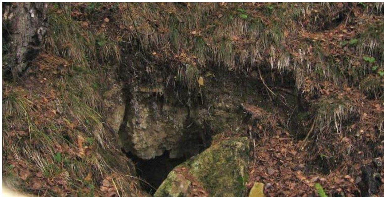
Вход в Уголёк после нашего вскрытия. Найдите 12 отличий от естественной пещеры...