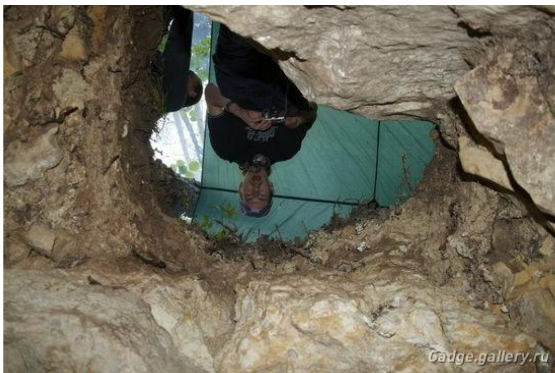
Тент над шурфом. По мысли фотографа, всё должно выглядеть именно так.