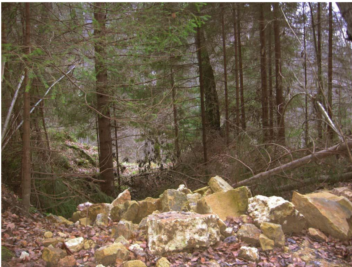
Типичный раскопочный пейзаж – вид на каньон. Все эти булыганы изъяты нами из шурфа, – причём на фотографии лишь верхушка нашего каменоломенного айсберга.