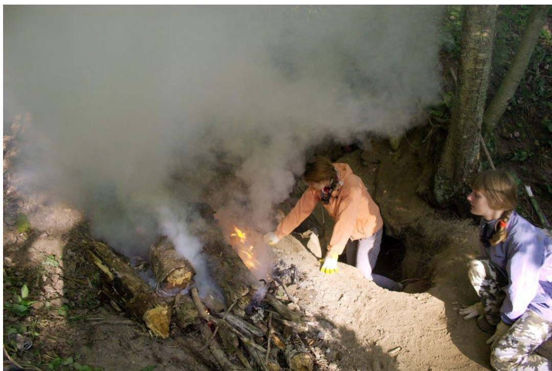
Июньские раскопки без антикомариного костра просто немислимы... ( С комарами и дымом борются Бегемотик и Черепашка. )