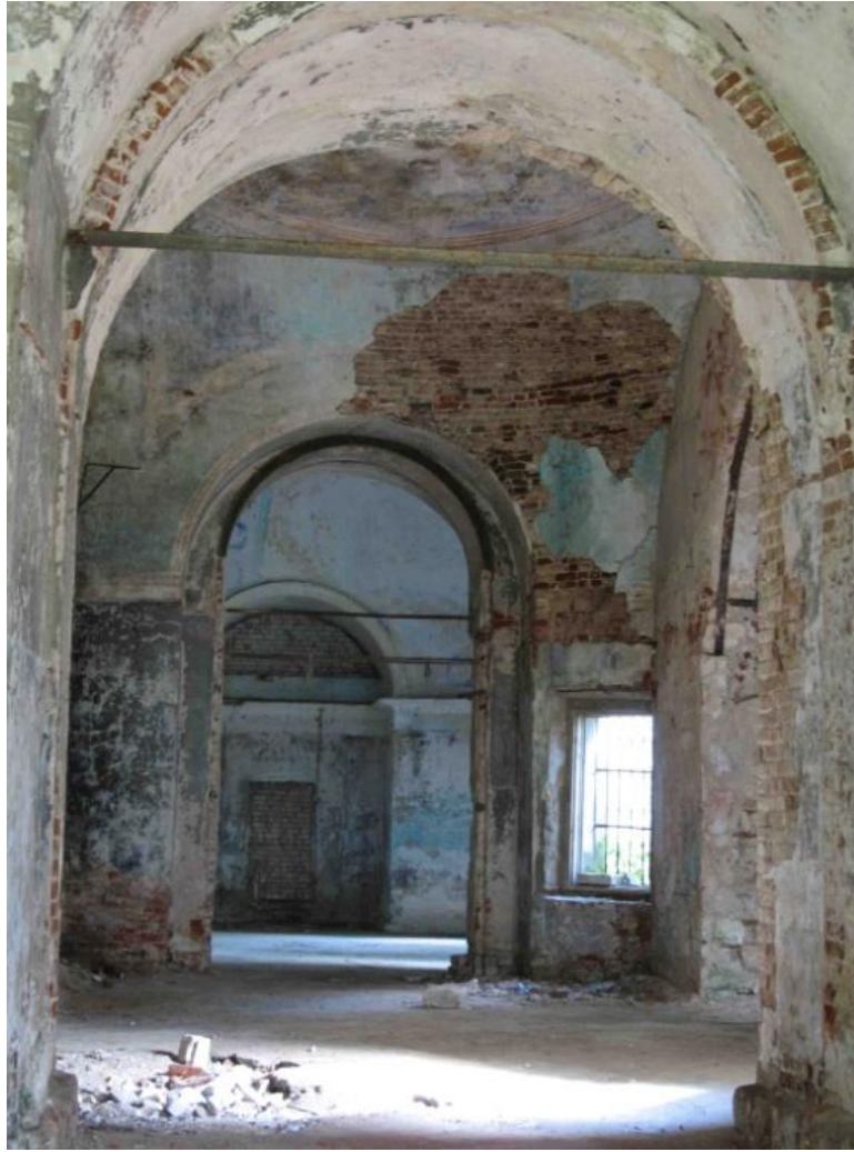
“Dark Side of the Cult”