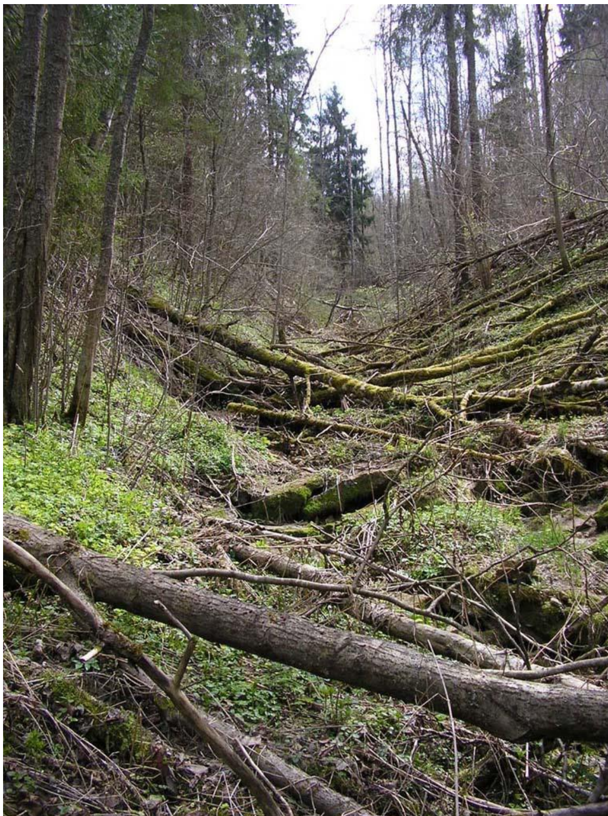
Верховья Баламутовского оврага.