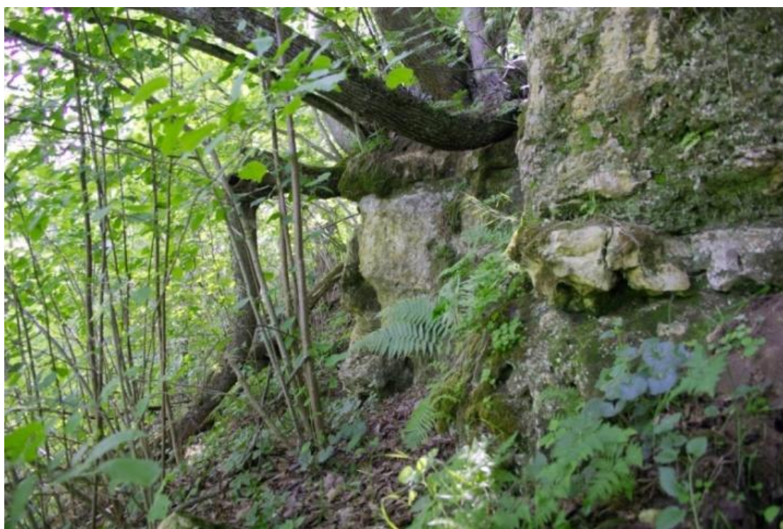
Типичный волжский склон со скальным выходом.