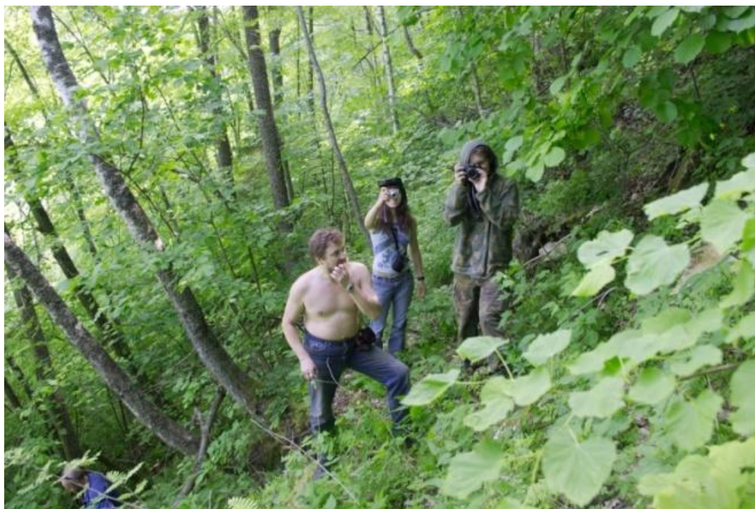
Июньский Свободный Поиск. Почему Кис-Кисыча не жрут комары – загадка. Гео, например, жрут ( он справа ).