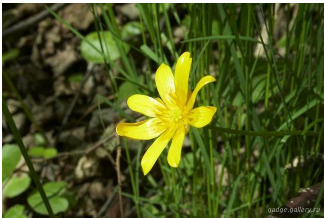
Первый весенний цветок.