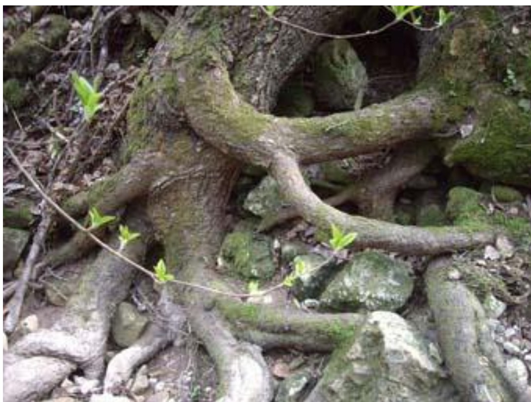
«Roots to Branches»