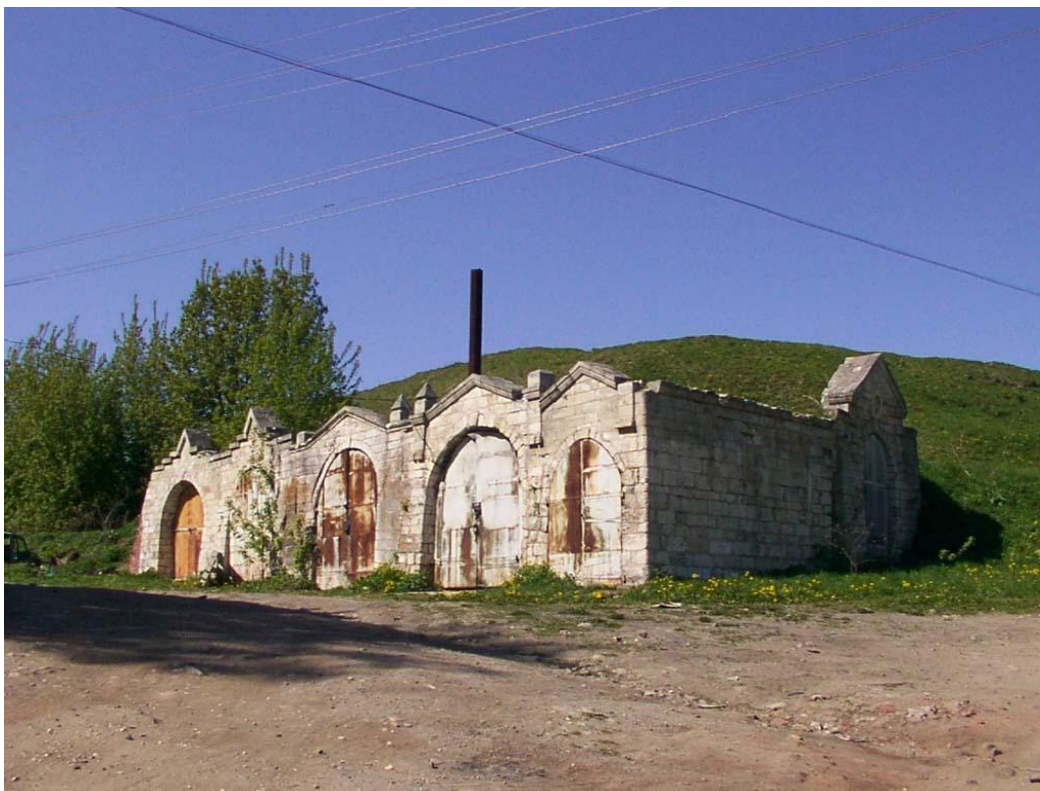
Спелестологические объекты сочетационного вида класса ПСП: кузницы XVI века, встроенные в земляной вал Старого Городища.