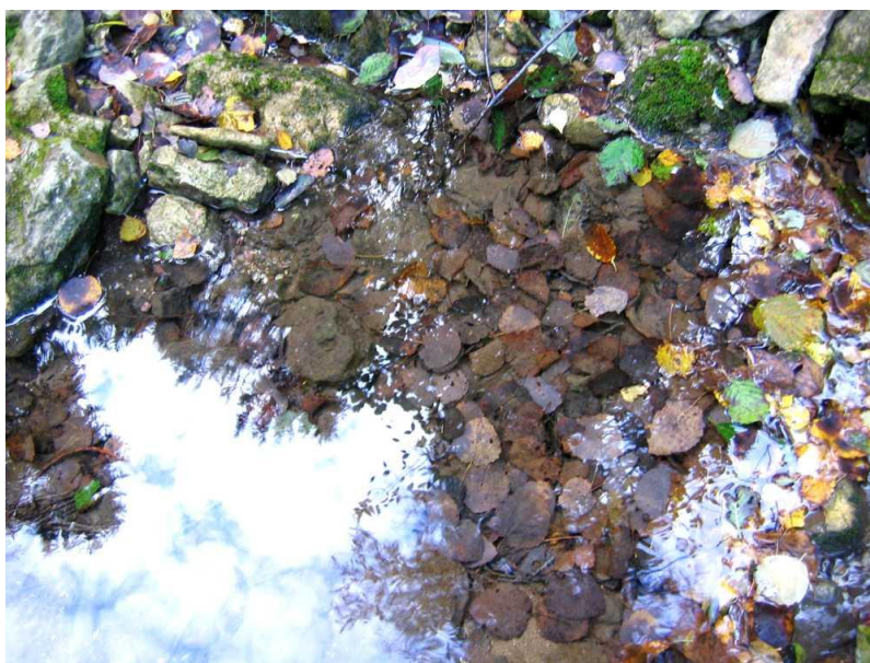
«Лишь земля, да небо...»