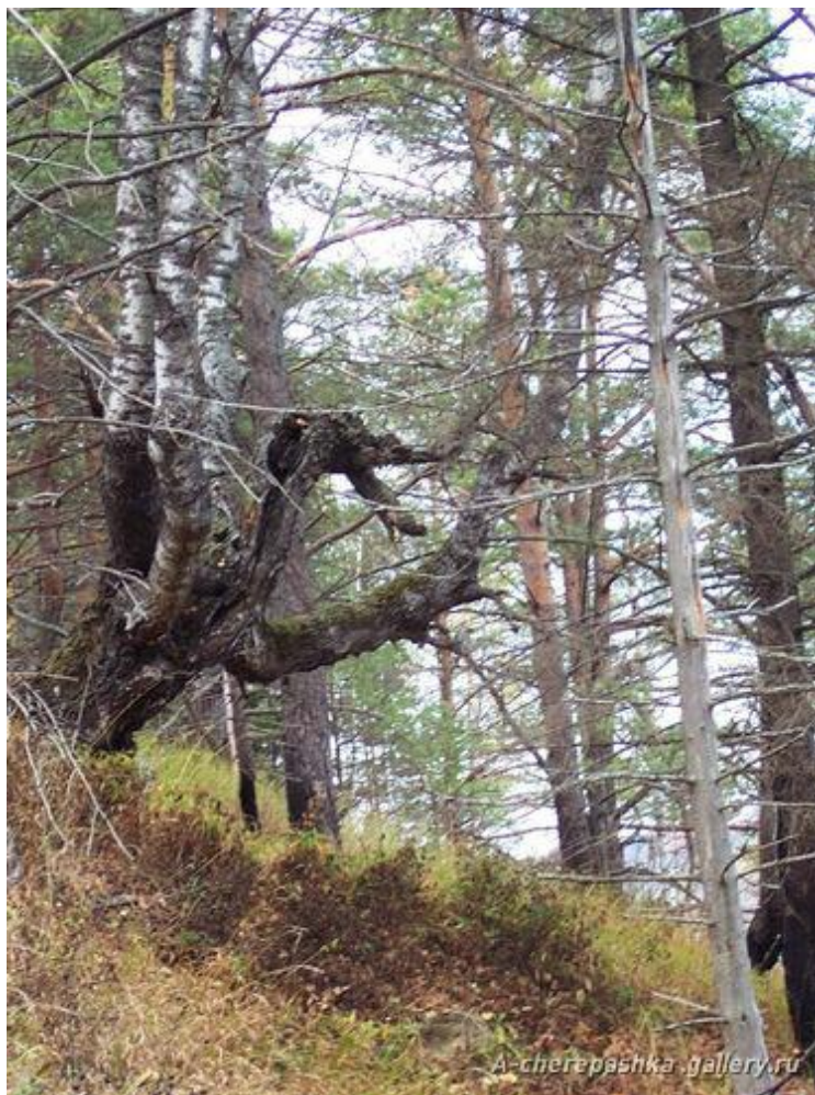
Кривая берёза – символ пещерного входа.