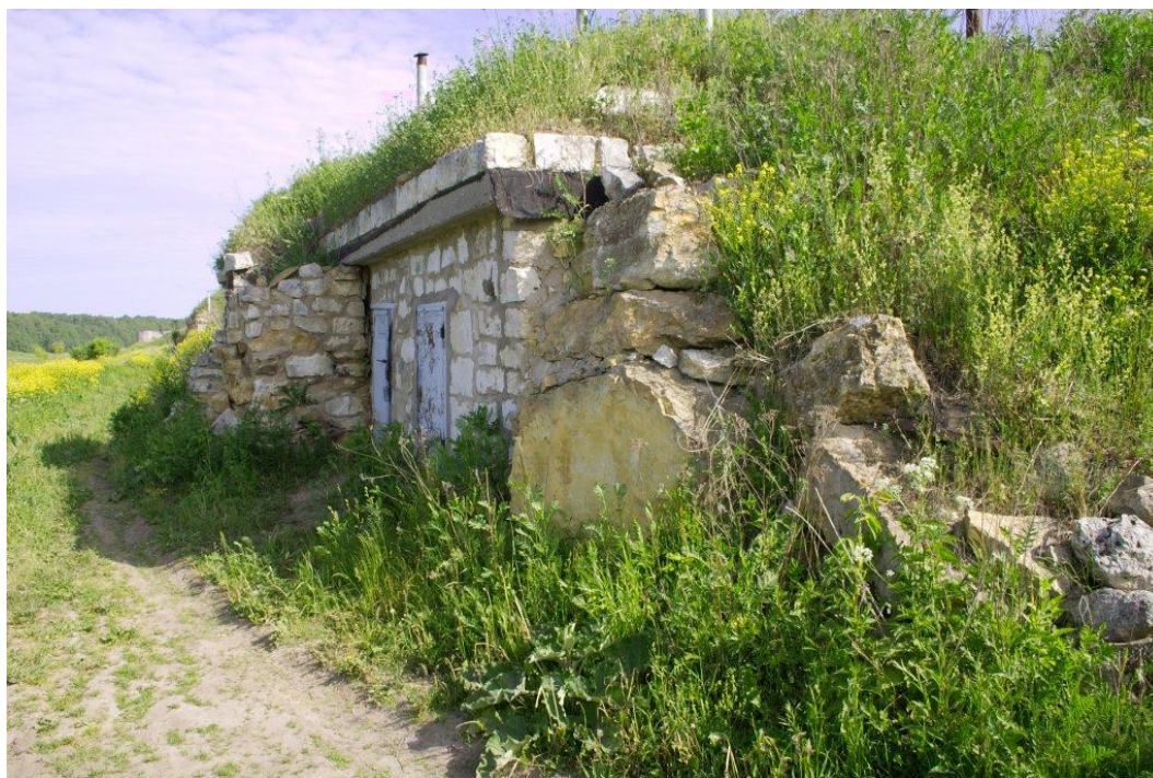
Знаменитые старицкие погреба ( безоговорочно: сочетационный вид ПСП ) – встроенные в точильные рвы и бывшие входы в каменоломни.