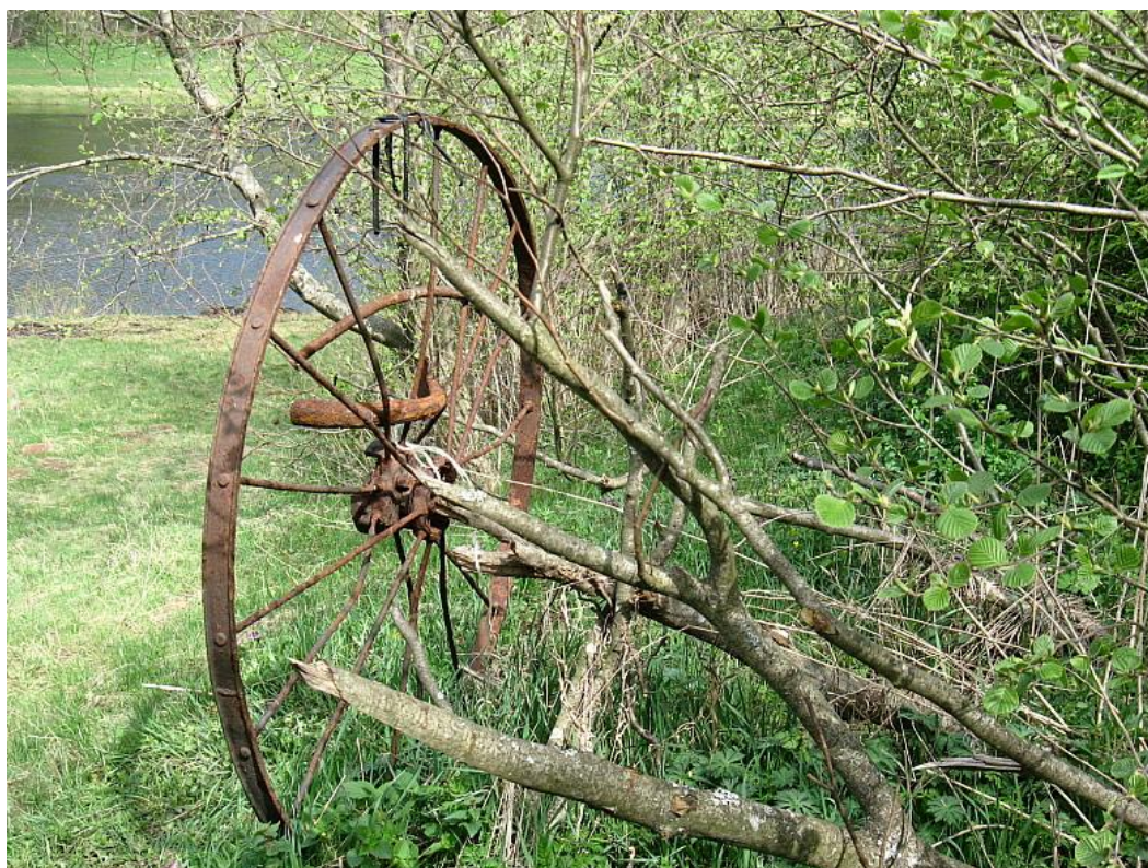
Один из любимых артефактов нашего Баламутовского лагеря – Колесо.