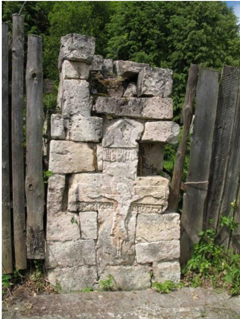
Реликты древней эпохи.