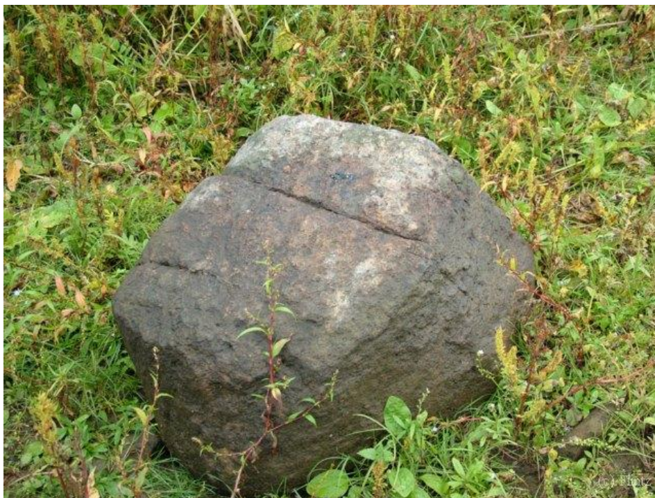
Загадочный камень с насечками.