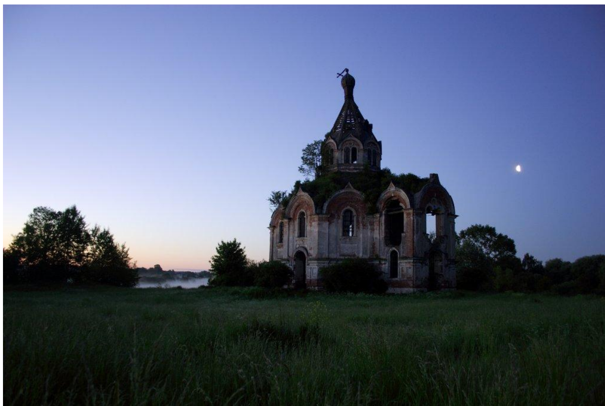
Гурьево. Здесь кончается не только асфальт...