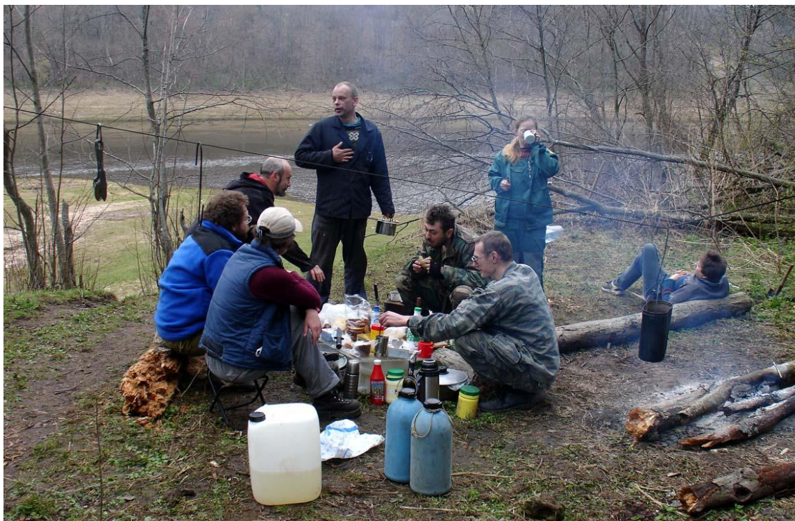
“Ну, за Приезд!..” – Олич, Прохор, Сом, Сусанин, Шериф, Длинный Кира, Люба и Кисыч: живые легенды НК в Старицком Действии.