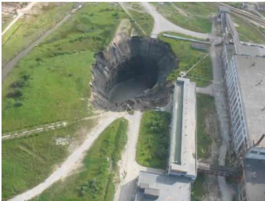
провал через 20 дней

Из оперативного сообщения Администрации края: "...Данное явление прогнозировалось на начальном этапе аварии, связанной с прорывом надсолевых вод в горные выработки рудника. Развитие ситуации контролируется путем видеонаблюдения в режиме реального времени с использованием передвижного пункта управления губернатора Пермского края и дирижабля краевого ГУВД. Угрозы для жителей города нет, ситуация находится под контролем. Возможное оседание земной поверхности в районе прорыва рассолов в шахту прогнозировалось учеными с первых дней аварии на руднике БКРУ-1. В соответствии с рекомендациями ученых доступ людей в опасную зону был прекращен, производственные объекты законсервированы и частично демонтированы. В связи с тем, что в зону возможного провала попали газопровод и часть железной дороги, было принято решение о переносе газопровода и строительстве обходной железнодорожной ветки. В целях минимизации последствий аварии на руднике БКРУ-1 был оперативно организован комплексный мониторинг как на территории БКРУ-1, так и в других районах города. Границы провала и процесс его образования полностью соответствуют прогнозам ученых, сделанным на основании результатов мониторинга опасной зоны."