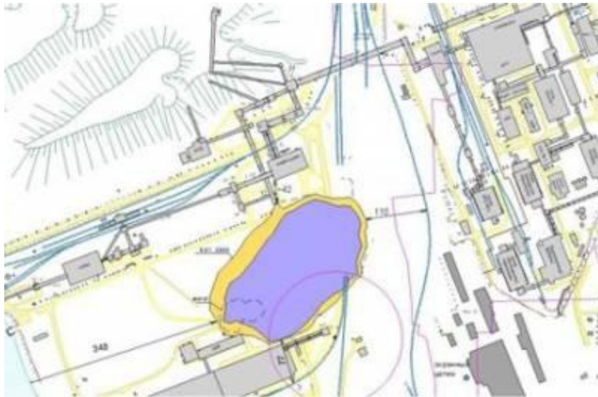
провал в январе 2008г.

К январю 2008 г. провал в плане составлял уже 337 x 202 м, в коренных породах – 305 x 170 м. Обрушения продолжались в рыхлых породах на север в сторону здания новой сушки и с восточного борта провала. Расстояние от провала до действующей обводной железнодорожной ветки на составляло уже всего 105 м. Общий объем пустот в руднике - 81,7 млн. куб. м. Из них к январю было заполнено рассолами около 43,09 млн. куб. метров.